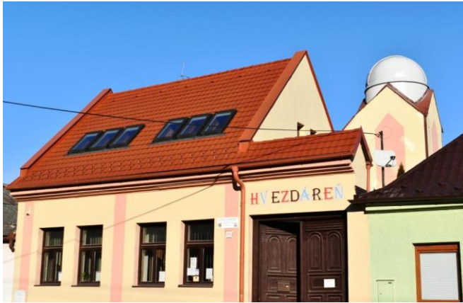
A Mecenzéfi Csillagvizsgáló bejárata, háttérben a kupolával