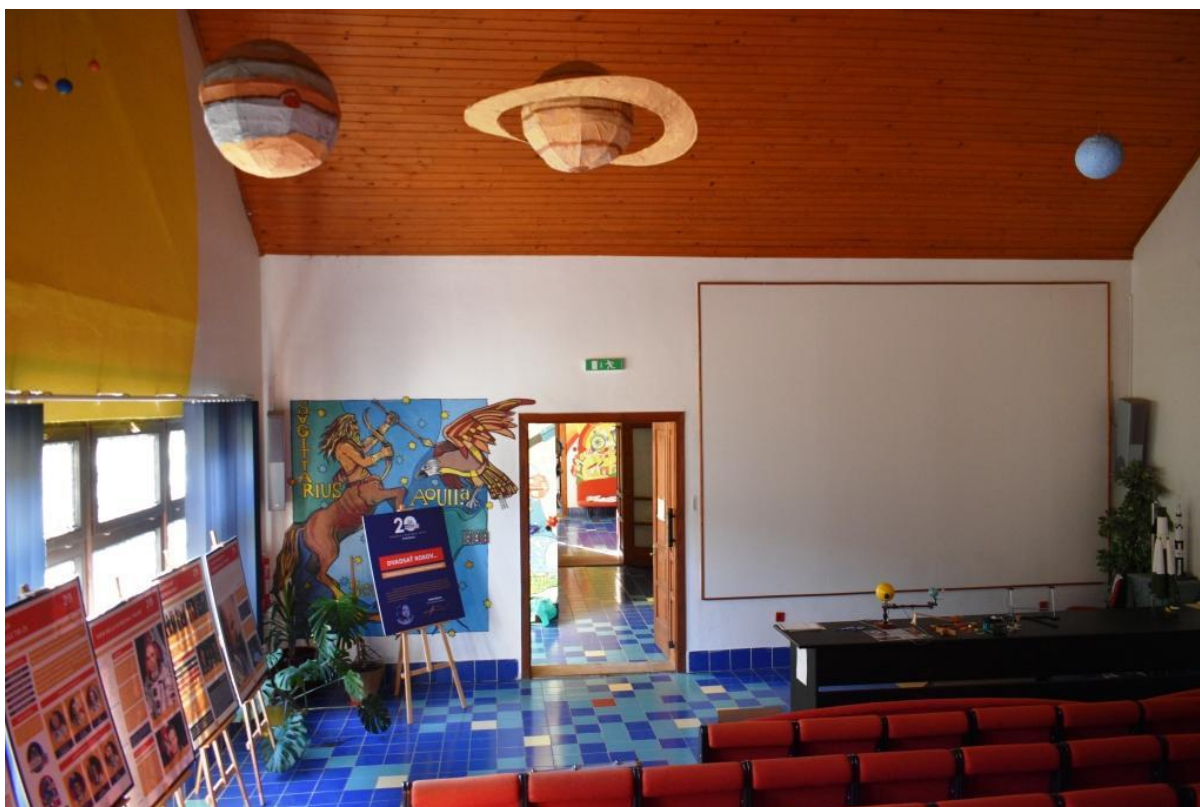
Az előadóterem az előadások és filmvetítések mellett kiállításokra is szolgál