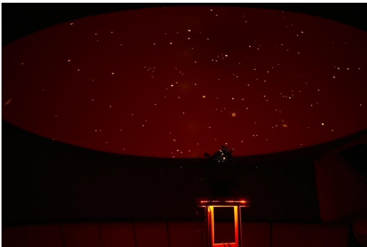
A planetárium előadás közben