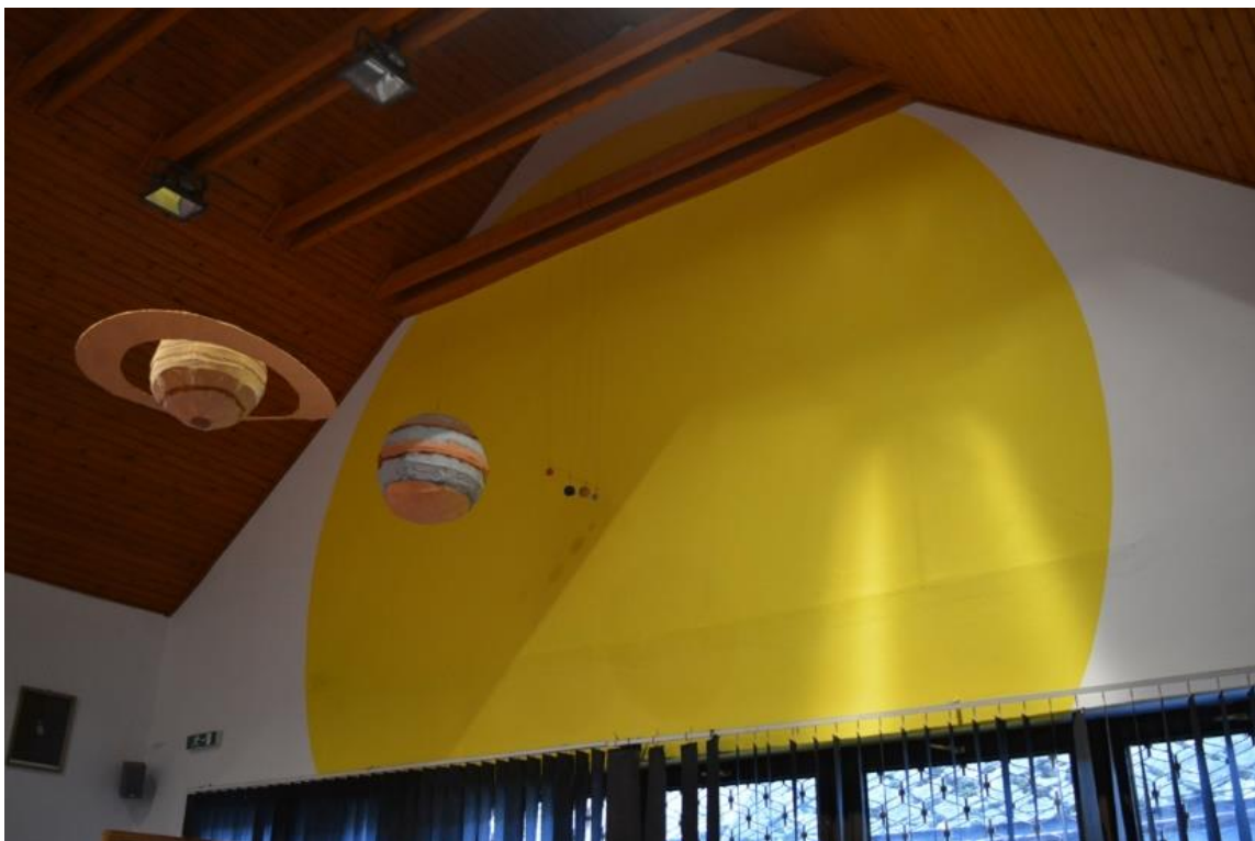
A bolygók makettjei a belső térben