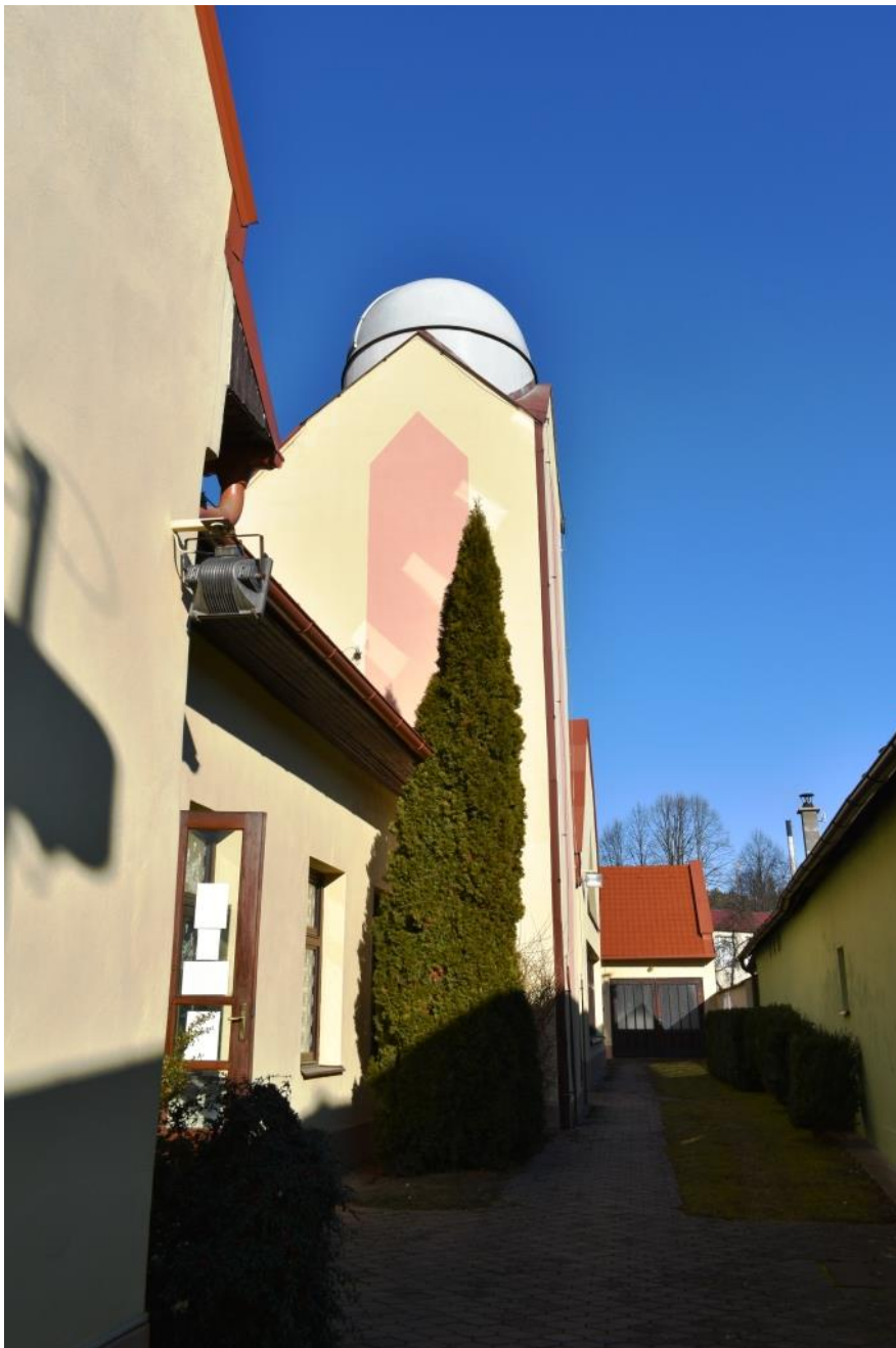
A jellegzetes épület tetején a kupola látható