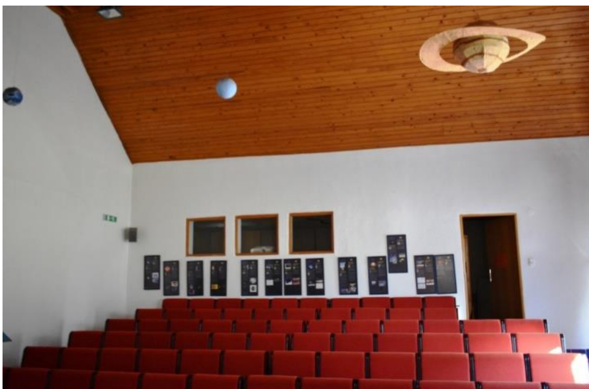
Az előadóterem a vetítőképek felől